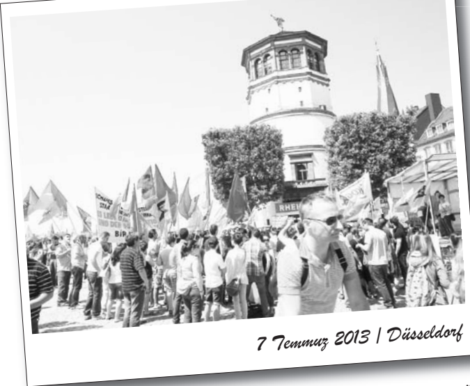
7 Temmuz 2013 | Düsseldorf

7 Temmuz günü, sermaye devletinin provokatör başbakanı Tayyip Erdoğan'ın Düsseldorf'ta gerçekleştirmek istediği "Demokrasiye saygı" adlı mitingi protesto etmek amacıyla bir miting gerçekleştirildi. Mitingi BİR-KAR'ın da bileşeni olduğu ve ATİK, ADHK, AGİF, Yaşanacak Dünya gibi kurumların da içinde yer aldığı Taksim Dayanışması NRW insiyatifi düzenledi.