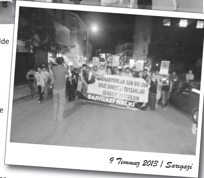
9 Temmuz 2013 | Sarıgazi

Ankara Emek ve Demokrasi Güçleri 9 Temmuz'da bir eylem gerçekleştirdi. "Her yer Taksim her yer direniş!" şiarlı ozalitle yapılan yürüyüşe BDSP'nin yanı sıra devrimci ve ilerici kurumlar katıldı. Yüksel Caddesi'nde toplanan kitle, buradan AKP Ankara İl Binası önüne bir yürüyüş yaptı. Burada basın açıklaması gerçekleştirdi. AKP İl Binası önünde yapılan basın açıklamasının ardından sırasıyla Mithatpaşa Cad., Meşrutiyet Cad., Karanfil Sokak güzergahını takip ederek Yüksel Metro alt geçidinden Güvenpark'a yüründü.